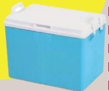
61€90 HT Glacière 52L Ref : 1059349