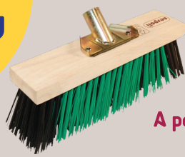
BALAI CANTONNIER 32CM Existe en 40 et 60 cm Ref : 1037792