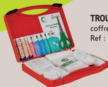
TROUSSE SECOURS coffret de 1 à 4 personnes Ref : 1020786