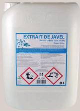
JAVEL 20L 9,6% CHLORE Existe en TRIPACK 3X250ML = 1,60 euros 5 L = 6 euros