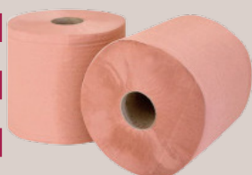
BOBINE CHAMOIS 1000 feuilles Lot de 2 bobines 23x30cm Ref : 3006242