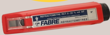
RÉFRACTOMÈTRE FABRE Ref : 1895