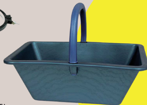
6€09 HT Panier récolte Avec anse fixe plastique bleu Ref : 8370