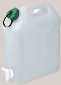
JERRICAN 5L Existe en 10 - 20 - 35L Avec robinet Ref : 1025510