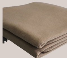
COUVERTURE POLAIRE 180/220