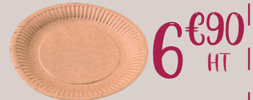
ASSIETTE BIODÉGRADABLE lot de 50 Ref : 1095619