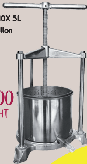
PRESSOIR INOX 5L pour échantillon Ref : 2061156