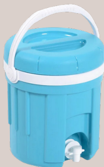
A partir de 16€90 HT FONTAINE 4L Existe en 8L Bleu/blanc Ref : 1059350