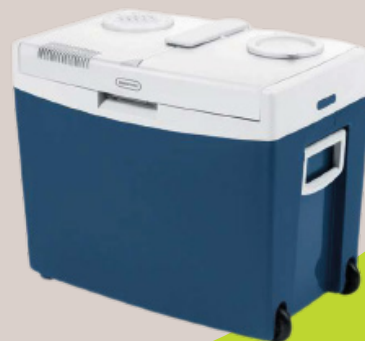
129€00 HT Glacière Thermo-électrique 35L Ref : 1099281