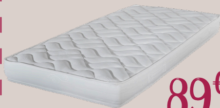
MATELAS MISTRAL 90/190 Ref : 1115227