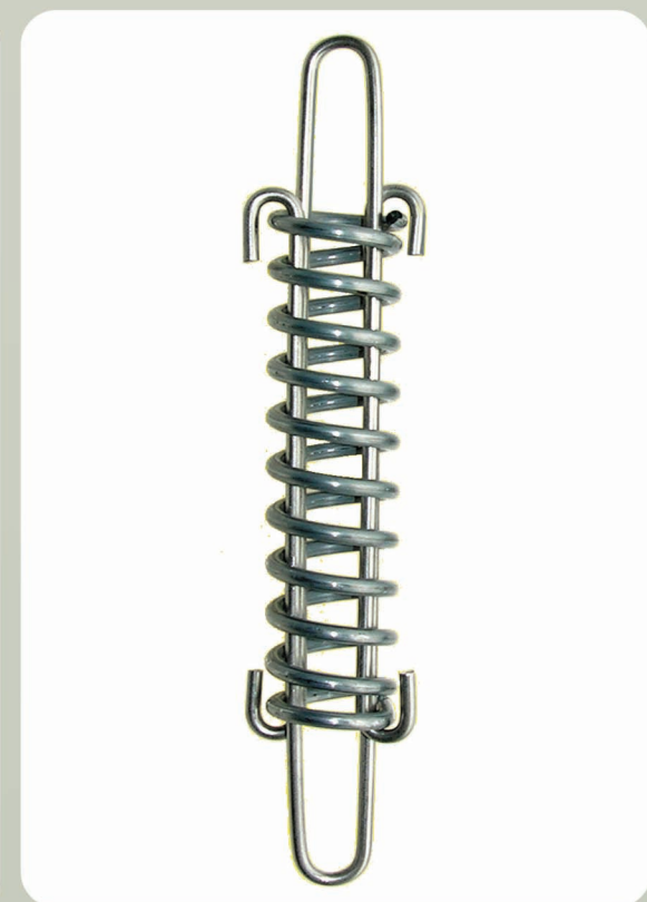
PUISSANCE 90kg Ø 3,5 mm